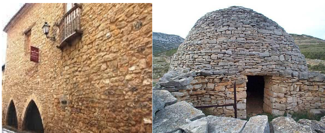
Il·lustració 3 - Museu de la pedra seca, Vilafranca