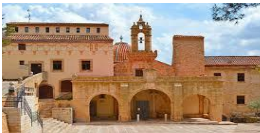
Il·lustració 10 - Reial santuari font de la salut, Traiguera.