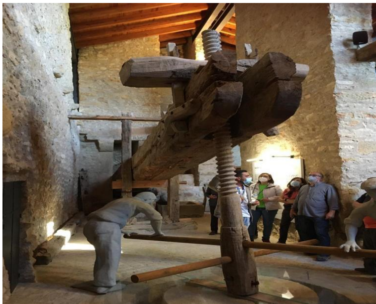
Il·lustració 2 - Museu de l'oli, Cervera