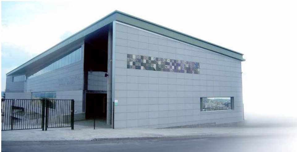
Il·lustració 7 – Museu de la ceràmica Manolo Safont, Onda.