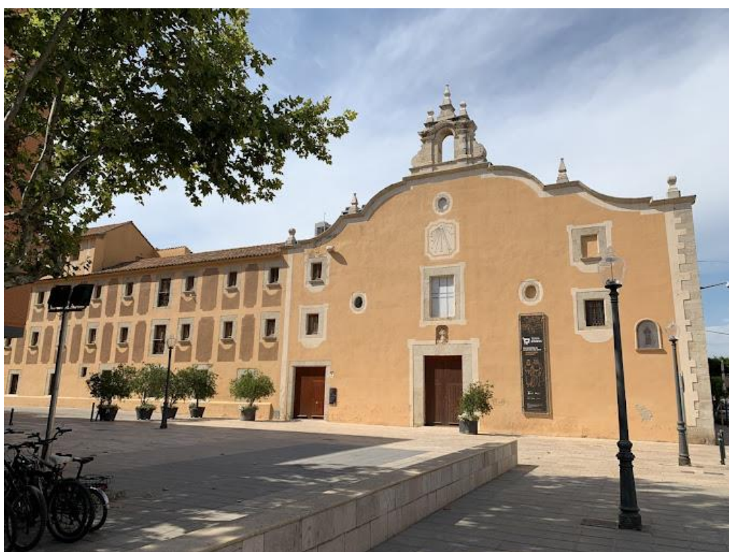
Il·lustració 4 - Museu MucBE, Benicarló.