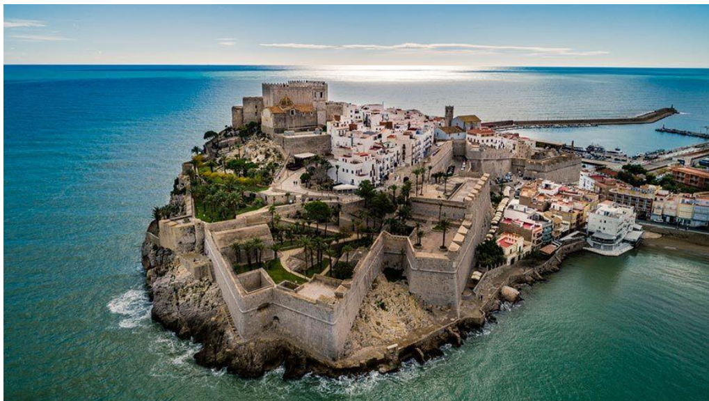
Il·lustració 6 - Castell de Peníscola.