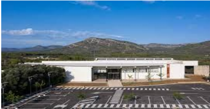
Il·lustració 1. Museu de la Vallorta, Tírig