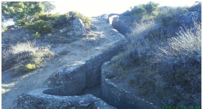
Il·lustració 9 - Museu CIBAL, Viver.