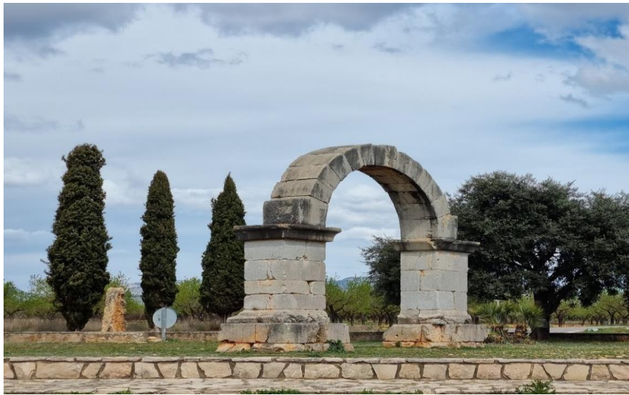
Il·lustració 5 - Arc romà de Cabanes.