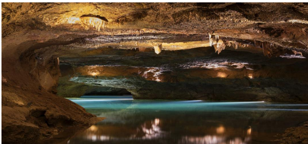
Il·lustració 8 - Coves de Sant Josep, La Vall d'Uixó.